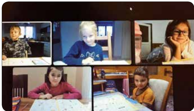
1. třída distanční výuka, 1. skupina