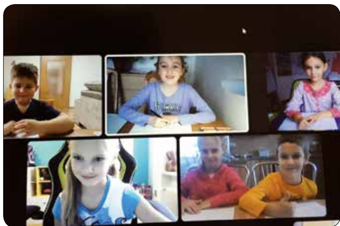
1. třída distanční výuka, 2. skupina