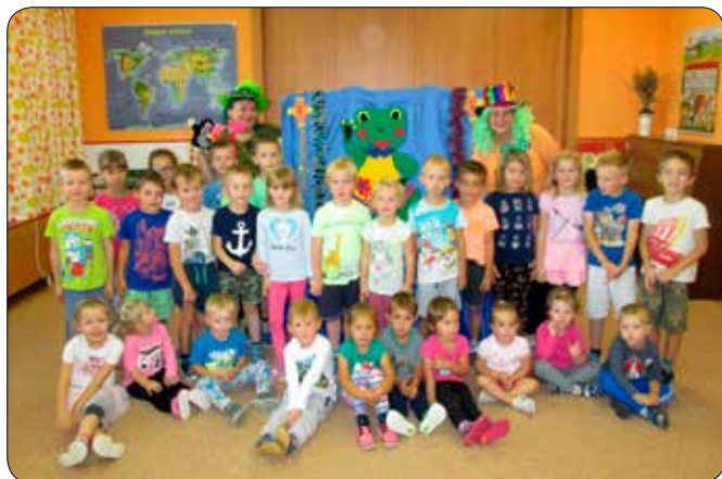
Divadelní představení ve školce