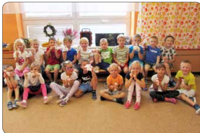
Projektový den Zdraví a bylinky