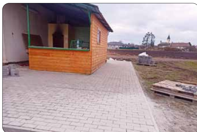
Stavební úpravy na fotbalovém hřišti