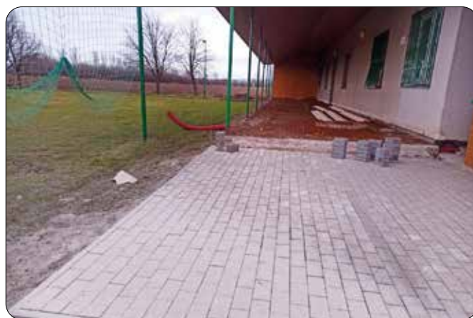
Stavební úpravy na fotbalovém hřišti