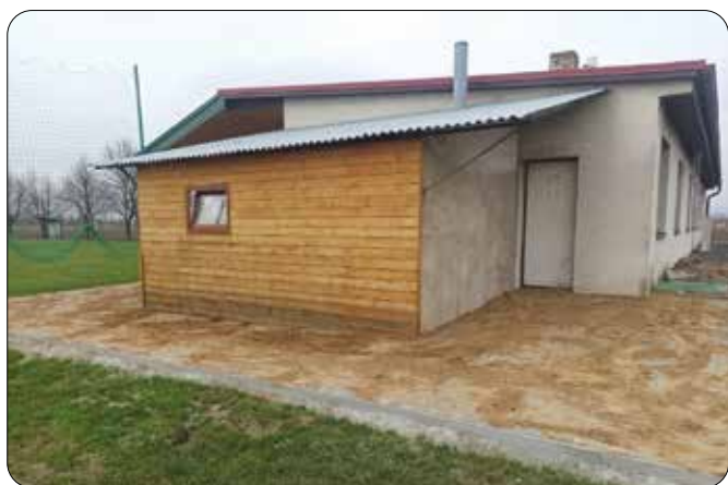
Stavební úpravy na fotbalovém hřišti