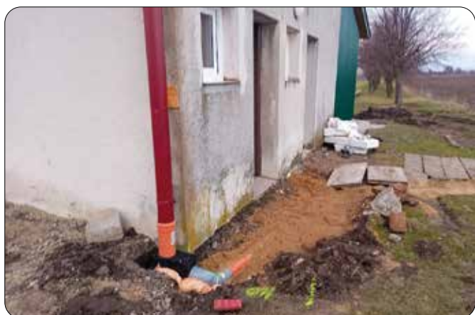
Stavební úpravy na fotbalovém hřišti