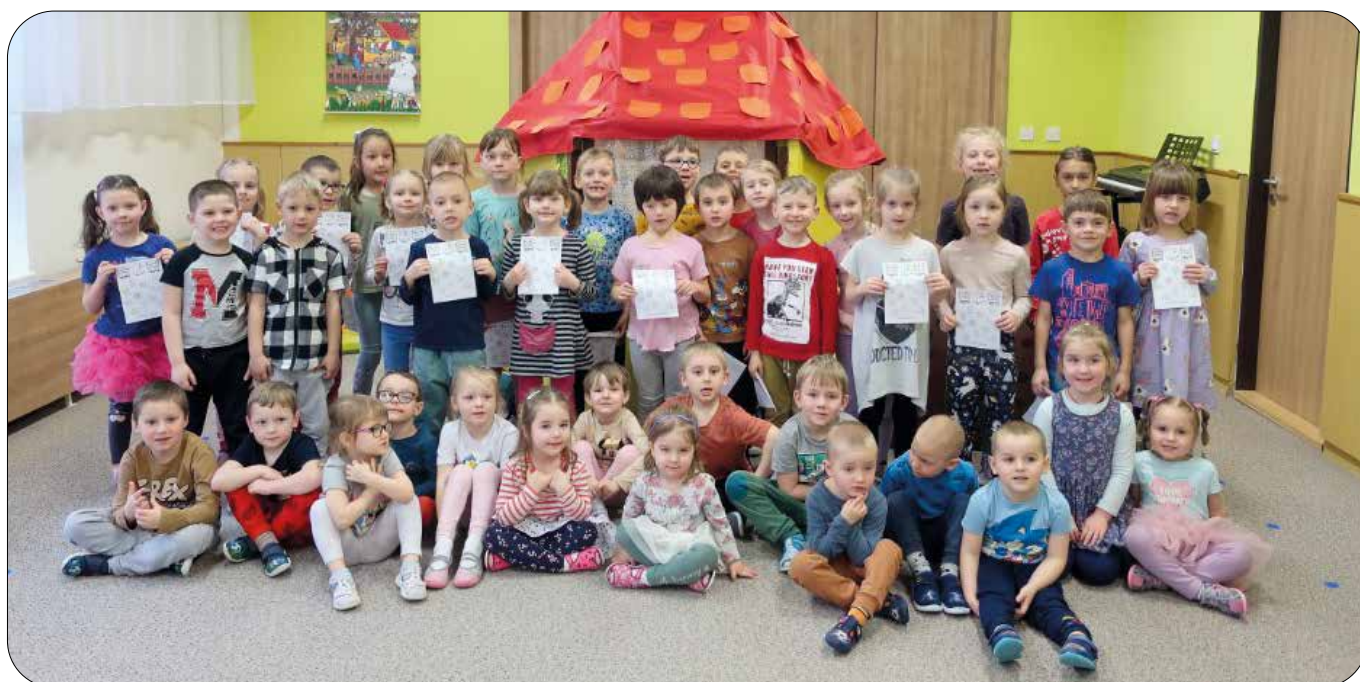
Divadýlko Květina v MŠ