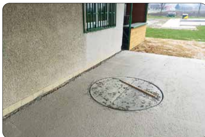
Stavební úpravy na fotbalovém hřišti